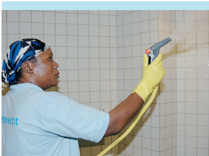
Schweißtreibende Arbeit: Die Fliesen im Duschbereich werden nach der Bearbeitung mit mikrobiologischem Reiniger abgesprüht.

Gemeinsam mit dem Dienstleister Wieprecht Gebäude-Manager