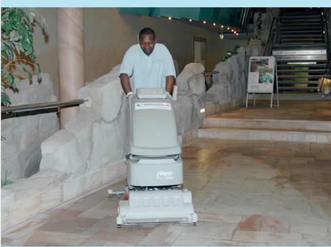
Nur noch ein Produkt für alle Flächen: „Biodor mit Kalkex“ wird auch in den Maschinen zur Reinigung des säureempfindlichen florentinischen Natursteinbodens eingesetzt. Die Maschinen werden zudem nicht mehr durch saure oder alkalische Reinigungsflotte belastet.

ment und Reinigungs-Service GmbH & Co. KG suchte man nach möglichen Lösungen. Rolf Lange, Betriebsleiter Wieprecht: „Wir reinigen hier sieben Tage in der Woche, 52 Wochen im Jahr, von 5 bis 9 Uhr. Wir sprechen betriebsintern von einer täglichen Grundreinigung. Das macht vielleicht den Anspruch deutlich, den wir selbst haben und der an unsere Arbeit gestellt wird.“