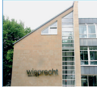
Lange Firmentradition, zeitgemäß aufgestellt: Das neue Firmengebäude von Wieprecht in Aachen.